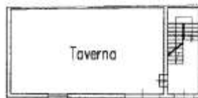
Pianta Piano Terra Via Vacirca N° 44 H=2.50